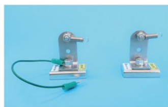
水平設置タイプ(高さ 35mm)